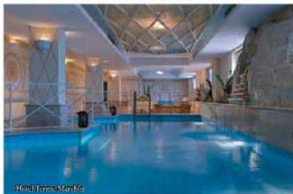
Hotel Terme Mareblu

some of the most beautiful thermal resorts that Ischia has to offer. L'Albergo della Regina Isabella is a historic hotel located in Lacco Ameno, the smallest town on the island. It began life in the 1950s to expand the Terme della Regina Isabella. A privileged destination for Hollywood stars, it stands out for its luxurious architecture, the refined atmosphere and the warm welcome offered to all guests.