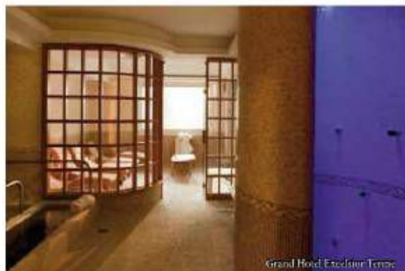
Grand Hotel Excelsior Terme