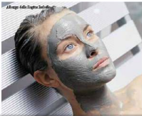
L'Albergo della Regina Isabella